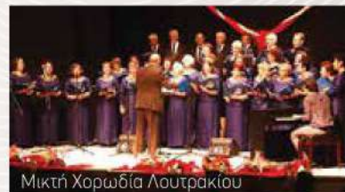
Μικτή Χορωδία Λουτρακίου