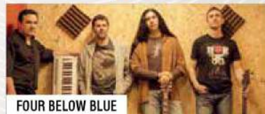
FOUR BELOW BLUE