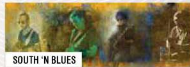
SOUTH 'N BLUES