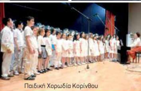
Παιδική Χορωδία Κορίνθου